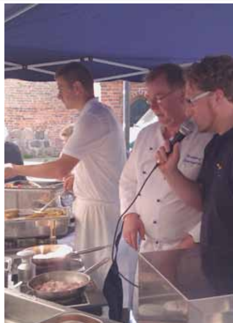
Schaukochen auf dem Wochenmarkt

Die sogenannten „Sozialen Netzwerke“ im Internet gehören mittlerweile zum Standard eines professionellen Marketings ebenso dazu, wie die üblichen Zeitungsanzeigen. Die ETMG ist daher seit einigen Monaten auch bei Facebook registriert und hat bereits über 600 Anhänger, die sich so ständig über Neuigkeiten im Ostseebad informieren. Neben Veranstaltungsterminen finden sich hier auch Fotos und Tipps zu aktuellen Themen.