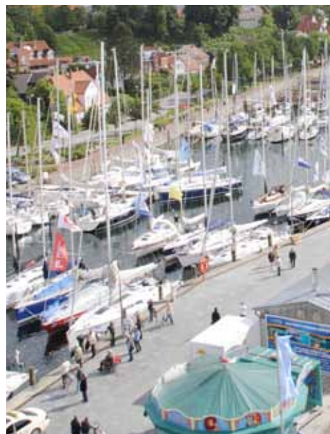
Voller Hafen bei Aalregatta und Welcome Race