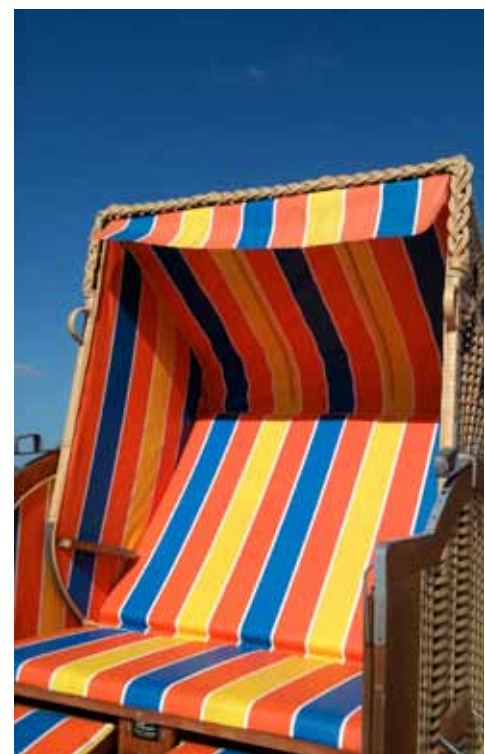
Strandkörbe: zurzeit sehr beliebt